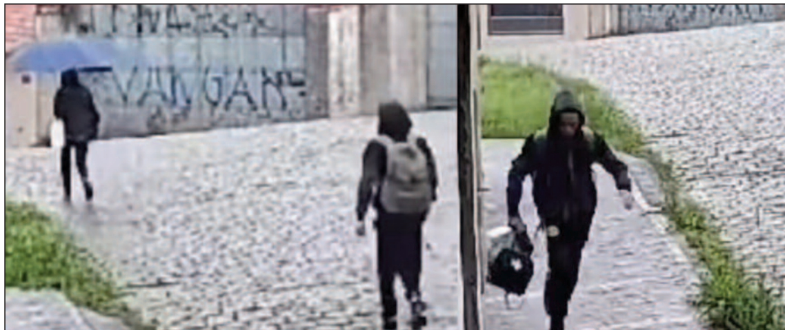
Mulher, de 60 anos, caminhava na via quando foi abordada por um indivíduo

Caso aconteceu na manhã desta quarta-feira (13), na rua Santa Helena