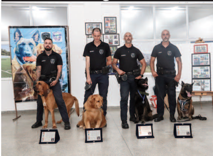
Grupo de Operações com Cães recebeu menção honrosa