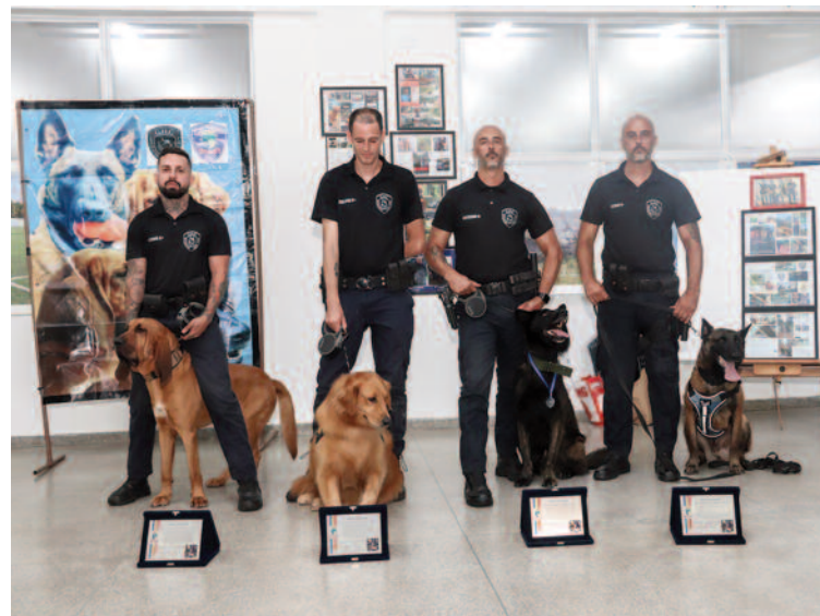
Durante solenidade, K9 Apollo recebeu medalha de honra