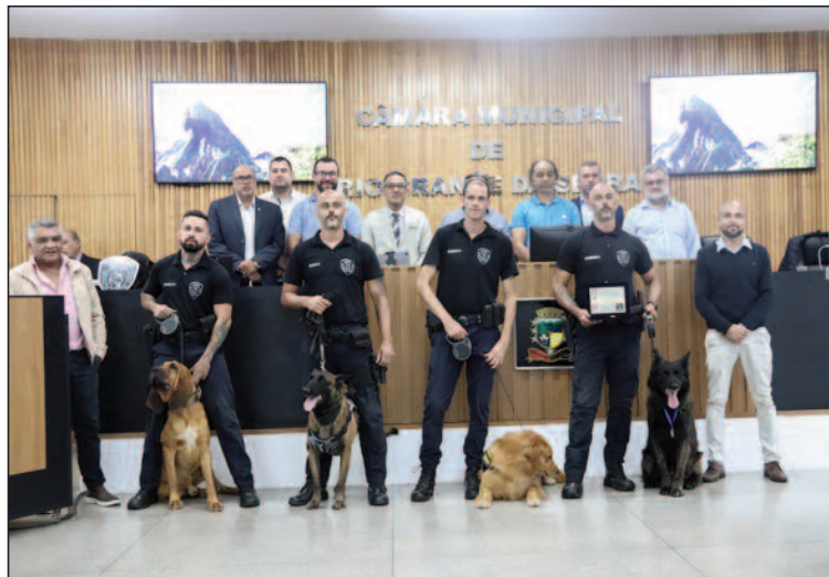
Homenagem foi entregue pelos vereadores de Rio Grande da Serra

Agentes municipais e cães policiais receberam menção honrosa pela atuação em casos no município