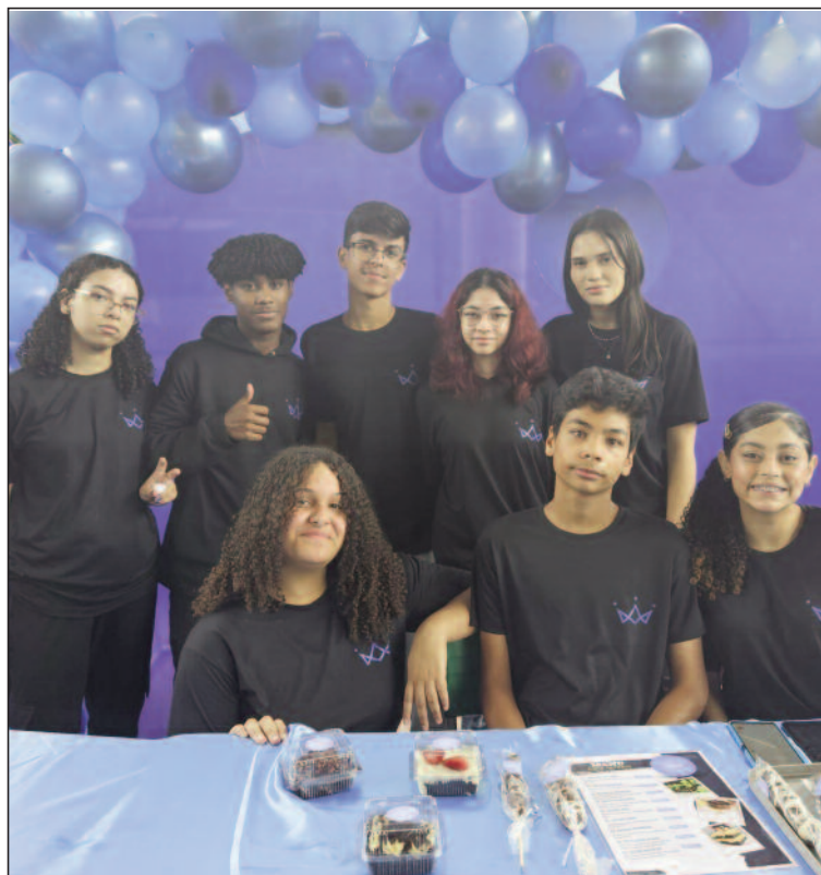
Doce Império foi uma das empresas criadas pelos alunos do Ensino Médio

Evento aconteceu na E.E. Profª Judith Ferreira Piva e contou com a exposição de empresas desenvolvidas pelos próprios alunos