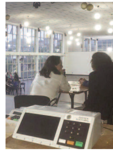
Última eleição aconteceu em 2023