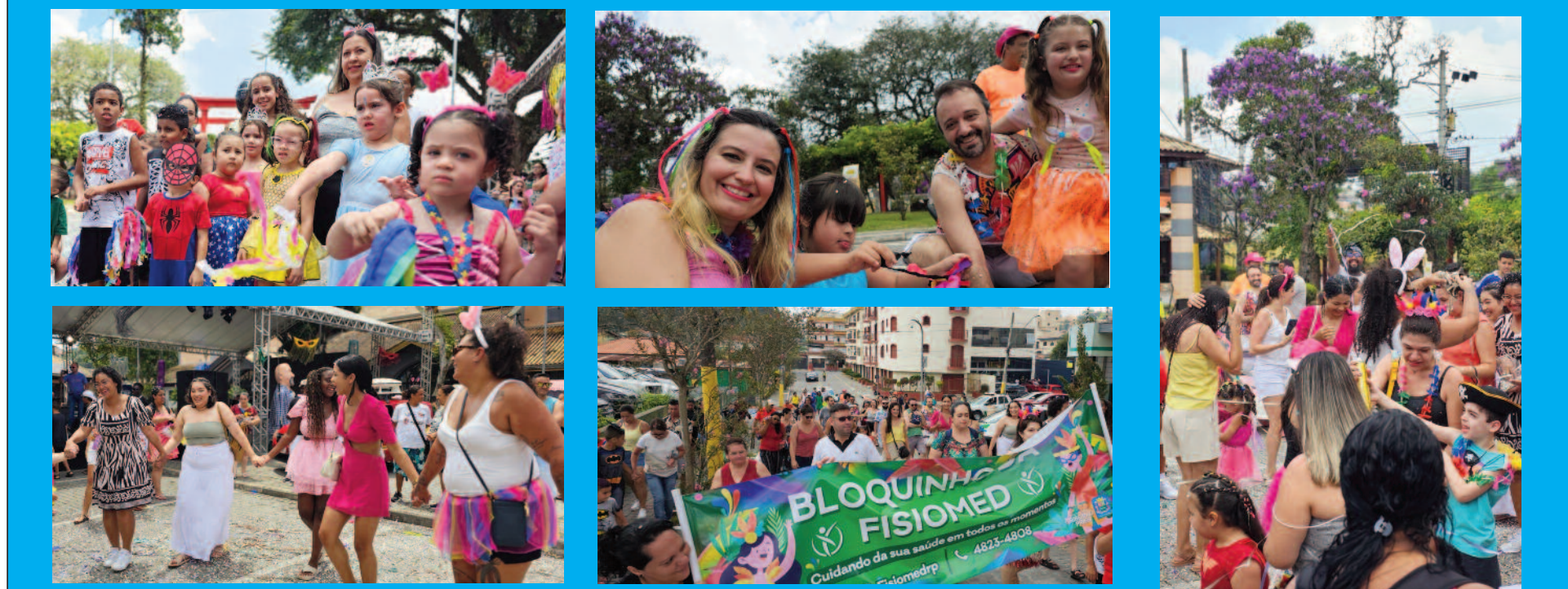
Momentos do Carnaval em Família em Ribeirão Pires; cerca de quatro mil pessoas se reuniram no Paço Municipal no último domingo (23)