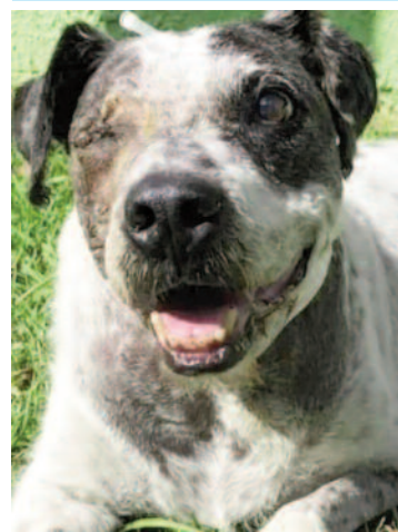
Cão foi brutalmente agredido em 2021

A OAB de Ribeirão Pires exibirá nesta quarta-feira (26), a partir das 19h, o curta-metragem que narra a emocionante história de Estopinha, um cão idoso conhecido na região central da cidade. Estopinha, que viveu por mais de 10 anos como cão comunitário em um ponto de táxi, foi vítima de