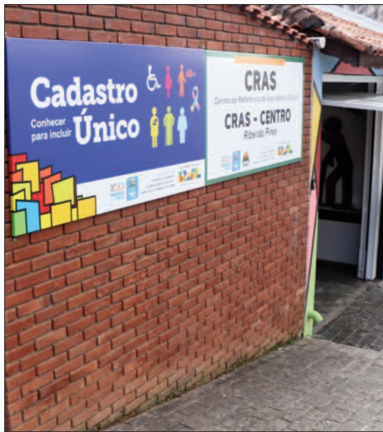
A SAPIS é responsável pela execução e gestão da Assistência Social

Recursos beneficiarão crianças, idosos, pessoas com deficiência e em situação de vulnerabilidade