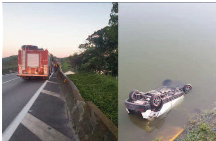
Carro da vítima foi encontrado capotado e parcialmente submerso

Caso aconteceu por volta das 4h45 desta terça-feira (25), na Rodovia Anchieta