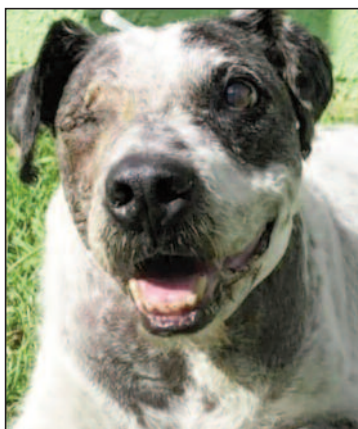
Cão Estopinha foi brutalmente agredido no ano de 2021

Curta sobre cão Estopinha será na quarta