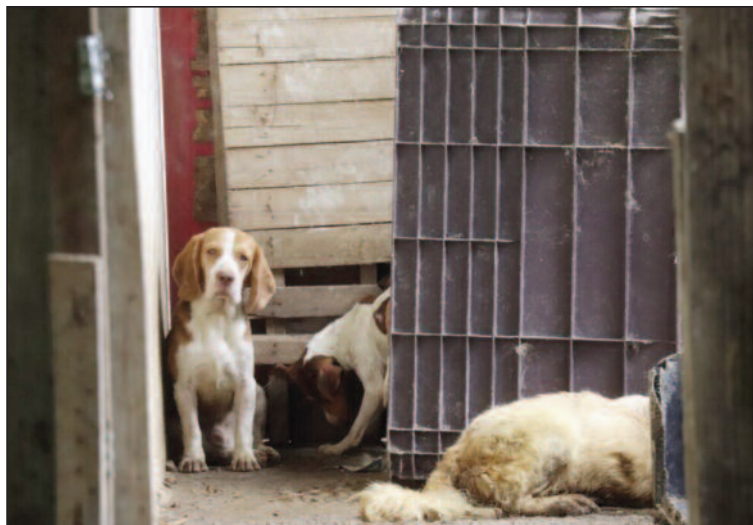
Em 2024, foram mais de 1.200 denúncias registradas no Grande ABC

Região registra aumento de até 100% nas denúncias, com destaque para abandono em áreas públicas e de mata