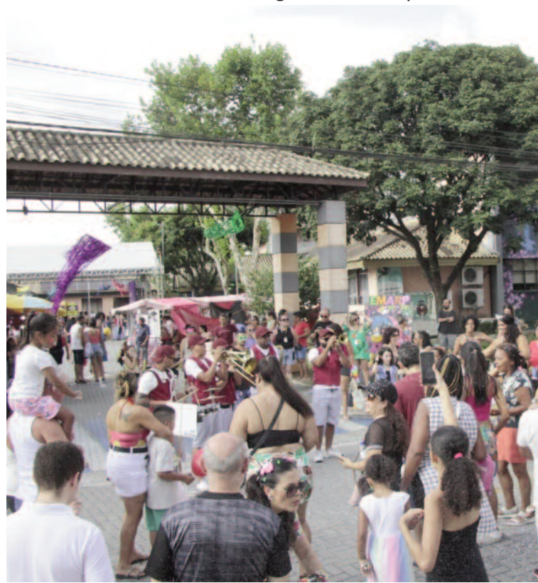
Pré-carnaval reuniu cerca de quatro mil pessoas no Paço da Estância

Em ambiente seguro, foliões puderam curtir músicas carnavalescas, bloquinhos, concursos de fantasia e muito mais