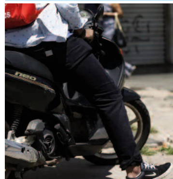
Caso aconteceu no dia 25/02

Um jovem de 18 anos sofreu um acidente após colidir com uma viatura da Guarda Municipal (GCM) de Ribeirão Pires enquanto pilotava uma motocicleta na Avenida João Baldi, no bairro São Caetaninho, próximo ao Rodoanel Mário Covas, na tarde da última sexta-feira (25).