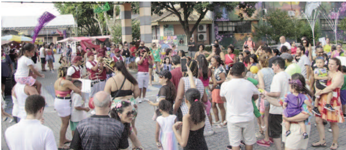
Folia marcou o início das festividades de Carnaval na Estância no último domingo (23)

Carnaval da Família reúne cerca de 4 mil pessoas