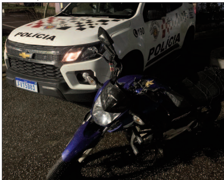
Motociclista, de 18 anos, teve veículo roubado por dois indivíduos

Suspeito foi encontrado dentro de um táxi momentos depois do crime