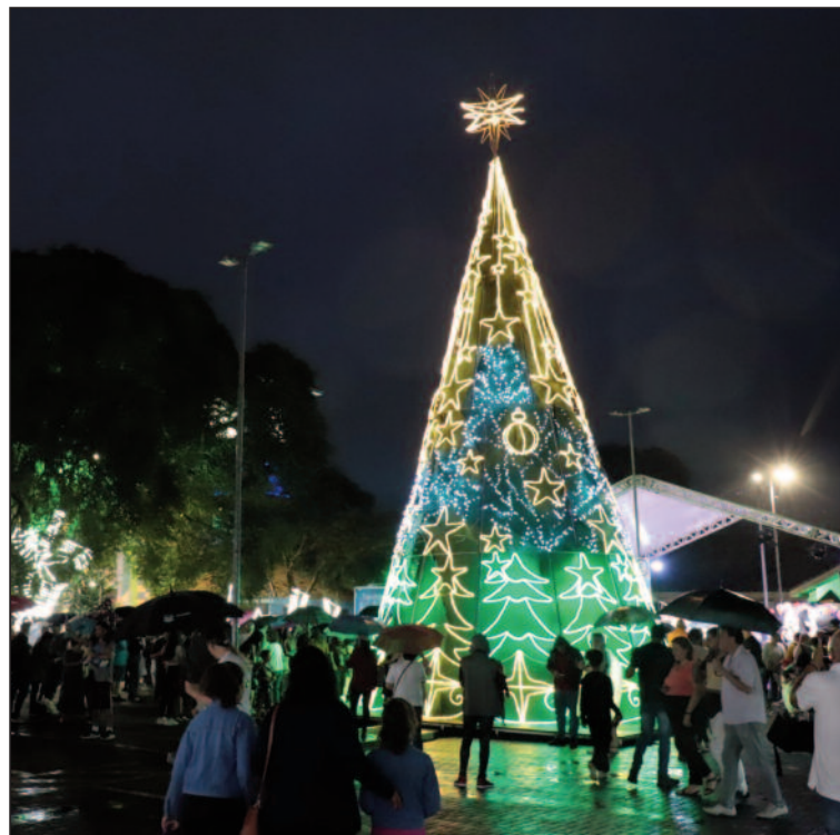
Evento contará com um desfile de natal pelas ruas da cidade

Evento natalino reúne apresentações culturais, artesanato, Festival do Cambuci e a chegada do Papai Noel