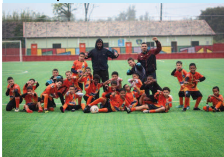
Equipe enfrentará o K9 Pro no próximo domingo (08), em São Paulo

O sub-11 do A.A. Ribeirão Pires garantiu vaga nas quartas de final da Copa Bandeirantes 2024 e enfrentará o K9 Pro no próximo domingo (08). A equipe encerrou a primeira fase na 2ª colocação do grupo C, com oito pontos.