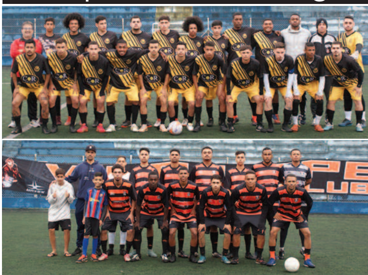
Santa Tereza e Vila Lopes se enfrentam no Teixeiraão