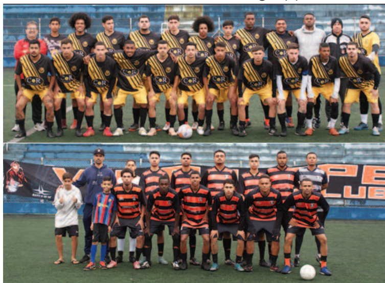
Santa Tereza busca a 3ª taça, enquanto o Vila Lopes anseia o título inédito

Final acontece neste domingo (8), no Estádio Municipal Teixeira