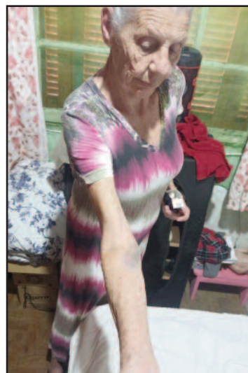
Paciente registrou b.o

Enfermagem da UPA Santa Luzia esquece agulha em braço de idosa