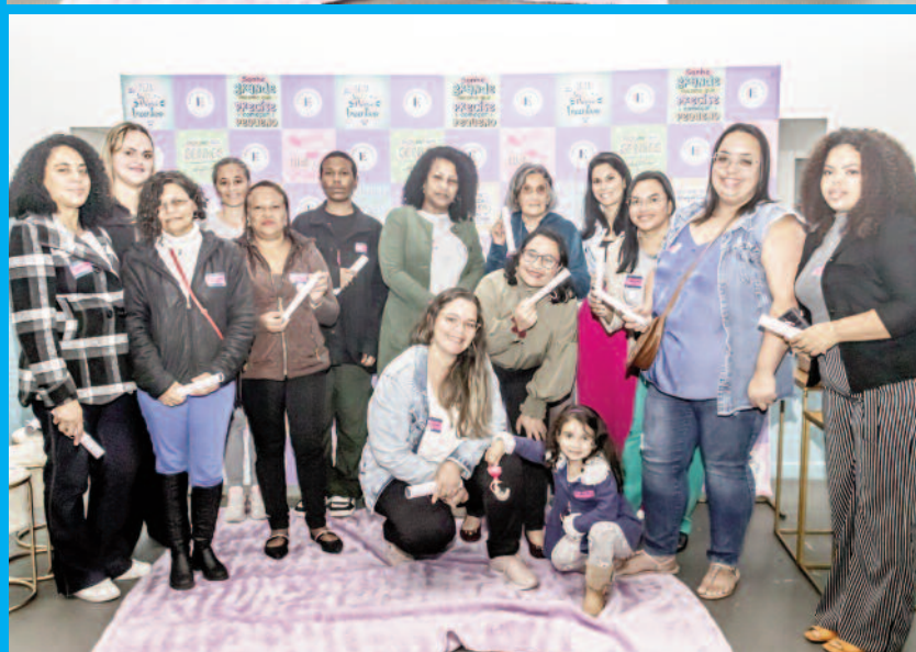
Momentos da Feira "Empreender Rio Grande Network" realizada na EMEB Profª Rachel Silveira Monteiro, onde houve uma tarde de imersão e conhecimento, palestras e pitch, coffee-break e certificação