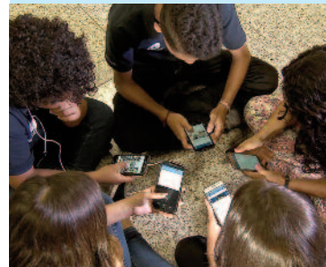
Medida entra em vigor 2025

A partir do ano que vem os celulares estão proibidos nas escolas, públicas e privadas, de São Paulo. O governador Tarcísio de Freitas sancionou o Projeto de Lei 293/2024, da deputada Marina Helou (Rede) e aprovado pela Assembleia Legislativa de São Paulo. A nova lei substitui e amplia a lei de 2007, agora proibindo os tipos de dispositivos eletrônicos, com a vedação passando a valer também para tablets, relógios inteligentes e aparelhos similares.