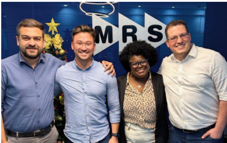
Projeto irá viabilizar viaduto próximo à Estação de Trem da CPTM

Transposição da linha férrea é demanda antiga e representará avanço