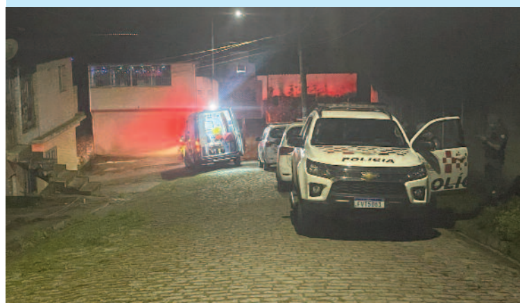
Rapaz tinha 39 anos e vivia como andarilho em razão do vício em crack

Um homem de 39 anos foi baleado e morto na noite da última segunda-feira (02), próximo a um ponto de tráfico de drogas na Vila Suzuki, em Rio Grande da Serra. Equipes do Corpo de Bombeiros e do Samu (Serviço de Atendimento Móvel de Urgência) realizaram procedimentos de reanimação, mas o óbito foi confirmado no local. A autoria e a motivação do crime ainda são desconhecidas.